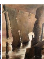
BEILLET LE BEHERC