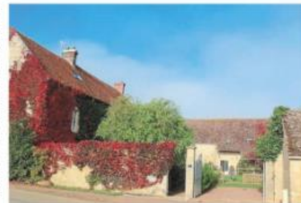
La ferme fortifiée, rebaptisée Clos de Tercey, depuis la route.