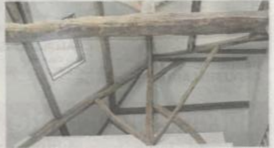
Des dizaines de mètres de poutres habillent les plafonds des bâtiments de la ferme.