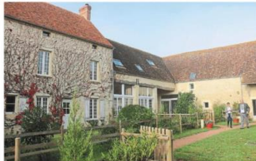
Vue depuis la cour fermée du Clos de Tercey. Les propriétaires revendent le lieu en plusieurs lots d'habitation.

À Tercey, on connaît surtout le moulin, inscrit aux Monuments historiques, et le château. La ferme fortifiée, renommée Clos de Tercey par ses actuels propriétaires, fut un temps rattachée au château. Hormis les habitations et bâtiments pour les animaux et les récoltes, elle comprenait plusieurs hectares de terres. « C'était encore une ferme il y a