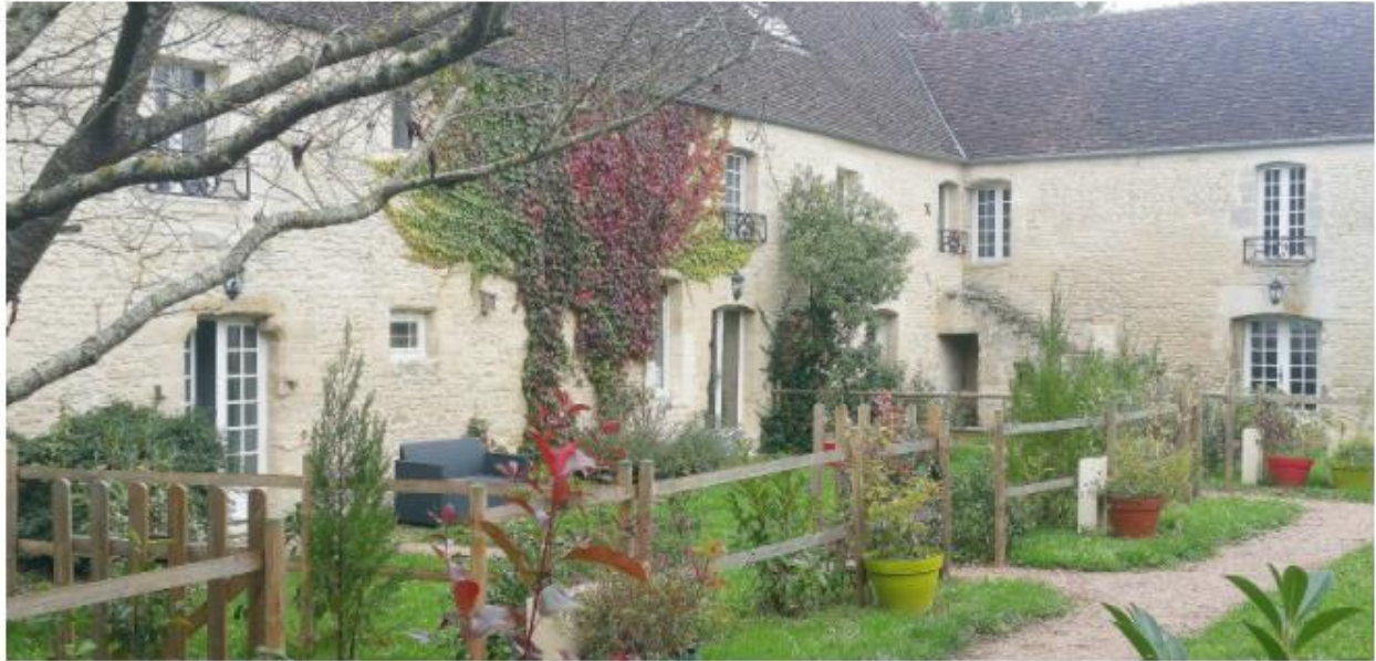
Le Clos de Tercey, ferme fortifiée restaurée.